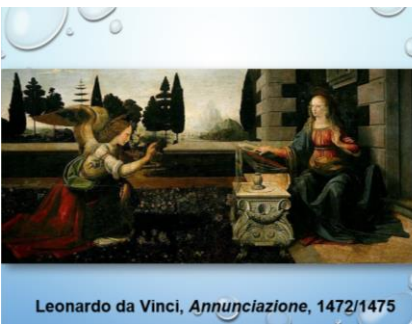
Leonardo da Vinci, Annunciazione , 1472/1475