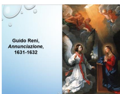
Guido Reni, Annunciazione , 1631-1632