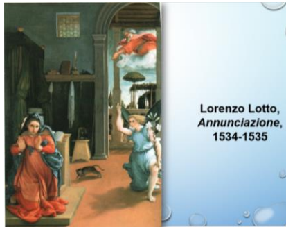
Lorenzo Lotto, Annunciazione , 1534-1535