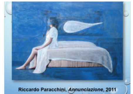
Riccardo Paracchini, Annunciazione , 2011