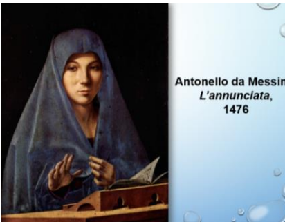
Antonello da Messina L'annunciata , 1476