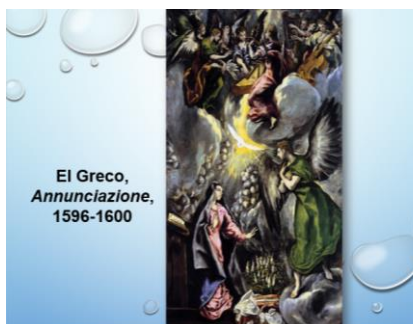
El Greco, Annunciazione , 1596-1600