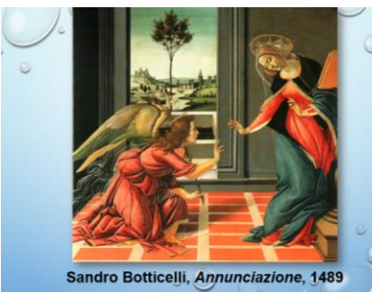
Sandro Botticelli, Annunciazione , 1489