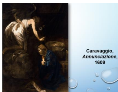
Caravaggio, Annunciazione , 1609