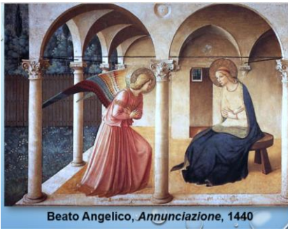
Beato Angelico, Annunciazione , 1440